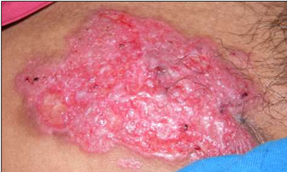
Foto 4: Evolución de placa de escrofulodermia con el tratamiento antifímico instaurado.

Foto 3: Placa eritematosa friable localizada en región inguinal derecha, compatible con escrofuloremia.