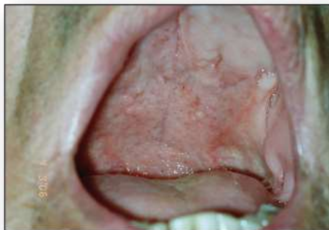
Foto 5: Múltiples pápulas y un nódulo amarillento localizados en paladar duro, compatible con TBC orificial.

El estudio histopatológico informó infiltrado inflamatorio inespecífico, necrosis y granulomas caseosos. El cultivo de la lesión resultó positivo para Mycobacterium tuberculosis . Con dichos datos se arribó al diagnóstico de tuberculosis orificial.