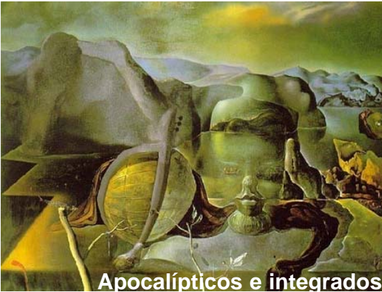
Apocalípticos e integrados,