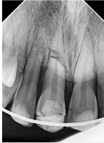
Fig.2. Imagen radiográfica preoperatoria

Se realizó historia clínica y médica sin evidencia de patología sistémica de relevancia.