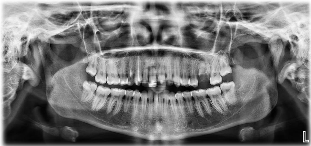
Fig.7. Estudio complementario. Radiografía panorámica

A los 28 días de la primera consulta, se realizó el tratamiento endodóntico, en donde se activó el irrigante con cavitador ultrasónico Woodpecker (Medical Instrument Co. China), con el fin de eliminar la medicación intracanal. Luego, el conducto radicular se obturó de forma permanente con puntas de gutapercha 25/06 (Meta Biomed. Corea) y cemento sellador (BIO-C® SEALER; Angelus. Brasil.) ( Fig. 8 ).