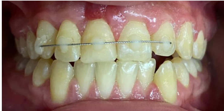
Fig.4. Férula lábil confeccionada con alambre de ortodoncia 0.4 mm.

Se le explicó a la paciente y su familia el tratamiento a seguir y se prescribió enjuague bucal con clorhexidina al 0,12% dos veces al día durante 7 días.