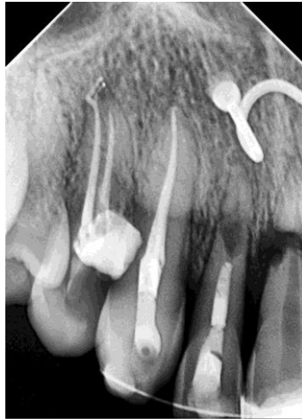
Fig.8. Radiografía posoperatoria inmediata

Los hallazgos clínicos y radiográficos después de 10 meses revelaron signos de anquilosis e inicio de reabsorción radicular ( Fig.9 ). A la paciente se le advirtió el inicio de la reabsorción y la necesidad de controles deben ser periódicos (cada 6 meses), con el fin de controlar el avance de la lesión.