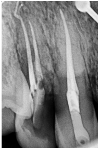
Fig.9. Radiografía de control a los 10 meses en donde se observa la presencia de reabsorción

Los hallazgos clínicos y radiográficos después de 10 meses revelaron signos de anquilosis e inicio de reabsorción radicular ( Fig.9 ). A la paciente se le advirtió el inicio de la reabsorción y la necesidad de controles deben ser periódicos (cada 6 meses), con el fin de controlar el avance de la lesión.