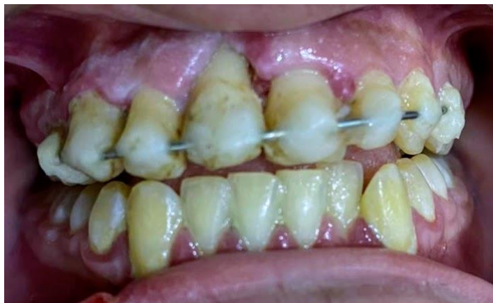
Fig.1. Imagen en donde se observa la presencia de una férula rígida.

El examen clínico intraoral y radiográfico reveló fractura radicular en elementos 11 y 12, reimplantación post avulsión elemento 13, fractura vertical elemento 14, luxación lateral elemento 21 y contusión en elemento 22. Las piezas dentarias se hallaban ferulizadas de manera rígida con un alambre 0,8 mm y grandes bloques de resina compuesta, como resultado del tratamiento odontológico de urgencias recibido anteriormente ( Fig.1 y 2 ).