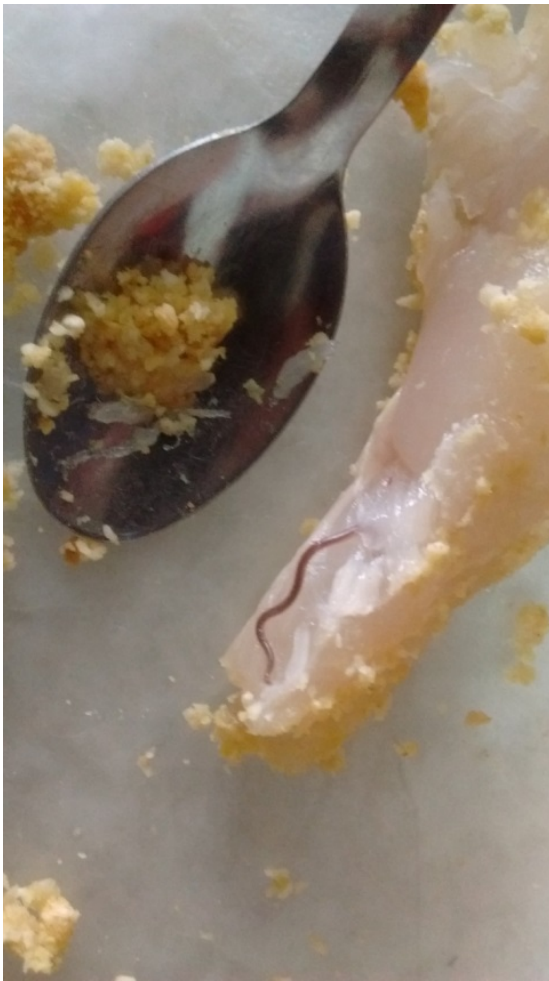
Larva de Anisakidae migrado en un filet de merluza.

La cuchara de referencia corresponde al tamaño café.