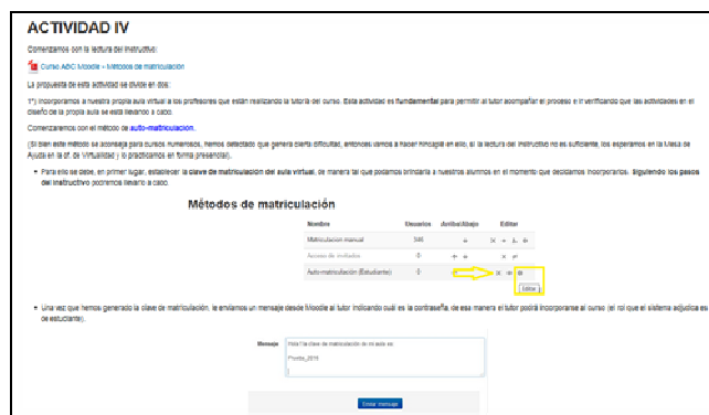
Ilustración 3: Pantalla ejemplo actividad del curso ABC Moodle

Para conocer la opinión de los docentes participantes se formuló una encuesta que fue suministrada en línea, cuyo enlace es: http://bit.ly/2q7hCvG . La misma fue respondida por el 38% de los docentes inscriptos en la modalidad tutorizada.