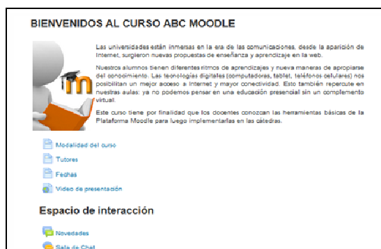
Ilustración 1: Pantalla ejemplo del curso ABC Moodle

Se incorporan algunas pantallas demostrativas: