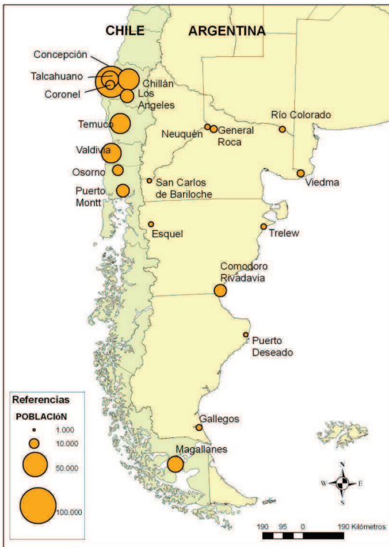
Mapa 1. Población total en ciudades y pueblos del sur de Argentina y Chile – 1930