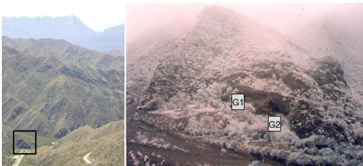
Figura 2: A la izquierda, vista general del morro en el que se localizan las Grutas de Vaquería. A la derecha, vista general de las Grutas G1 y G2 durante el invierno

período se estaba registrando el ingreso de productos y posiblemente (no suficientemente demostrado aún) prácticas agrícolas en la región (ver discusiones en Chiavazza 2001, Chiavazza y Mafferra 2007, Gil 1997-98).