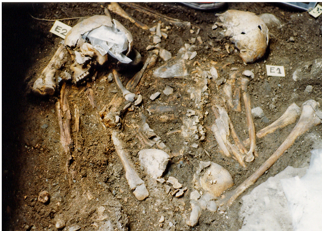
Figura 3: Vista de los esqueletos 1 y 2 excavados en la Gruta 1 del sitio Vaquería (RN Villavicencio, Mendoza)

límites de la fosa, los cuerpos se ubicaron dentro de un espacio demarcado por rocas del alero y dispuesto para el entierro simultáneo de ambos. Las posiciones no registran antecedentes en la bibliografía arqueológica regional. Los cuerpos estaban claramente imbricados, producto de un incuestionable depósito conjunto. Ambos se encontraban en posición sentada, con la cintura flexionada en el sector coxal y los pechos volcados sobre las piernas.