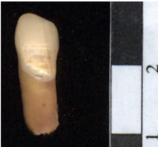
Figura 5: Hipoplasia dental individuo 1

Se analizó la totalidad de los dientes presentes, 24 corresponden al individuo 1 - (Figura 5) y 17 al individuo 2 (Figura 6), incluyendo incisivos centrales, laterales, caninos, primeros y segundos molares. De este total se descartaron para el análisis 2 molares debido al mal estado de conservación, ya que solo presentaban una pequeña parte de la corona.