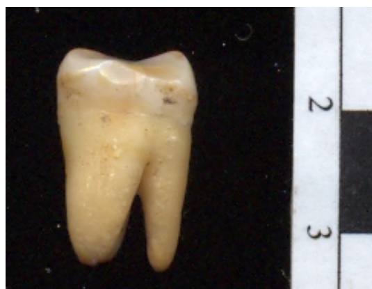
Figura 4: Desgaste dentario individuo 1

En el individuo 1 se registraron desgastes oblicuos muy marcados en el M1 izquierdo y M2 derecho de la mandíbula en el sector de las dos cúspides del lado bucal (Figura 4). En el individuo 2 no se registró este tipo de desgaste. La causa podría atribuirse al uso de estos dientes como herramienta.