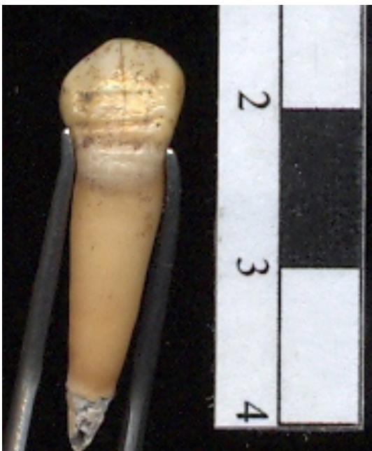
Figura 6: Hipoplasia dental individuo 2

Ambos individuos presentaron hipoplasias. Del total de los dientes analizados del individuo 1 el 71 % presentaron al menos una línea de hipoplasia y del total del individuo 2 el 65% (Tabla 1). Los porcentajes para ambos individuos son similares, sin observarse una diferencia llamativa para los distintos sexos. Los resultados del cálculo del índice de Simetría indican que es un 60% probable que las hipoplasias hayan sido causadas por procesos sistémicos en ambos individuos. El número mínimo de eventos de detención del crecimiento para el individuo 1 es uno y para el individuo 2 son tres. La presencia de hipoplasia en ambos individuos subadultos indicaría la posible existencia de algún tipo de estrés sistémico durante su infancia y niñez, etapas cruciales durante el proceso de crecimiento y desarrollo.