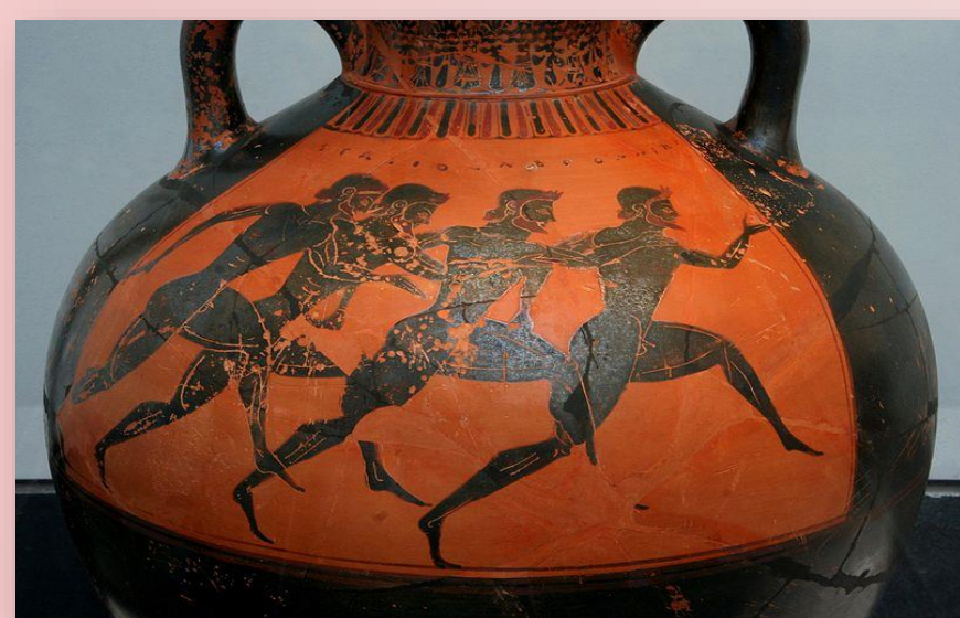
Fig. 2: Detalle de las Panateneas en una vasija griega de ca. 530 a. C.