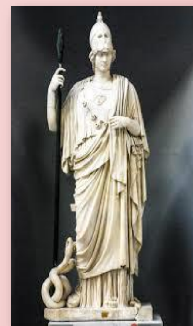
Fig. 5: Escultura de Atenea en el Museo Vaticano.

Si bien se ha comenzado la parte expositiva del trabajo, todavía falta profundizar esta etapa de escritura. Es por eso que se habla de resultados parciales, puesto que en este último momento de la investigación se advierte una notable discusión y confrontación entre lo que se ha escrito previamente y lo que se pretende aportar al estudio de la Historia, concretamente en el contexto de la Antigüedad Clásica.