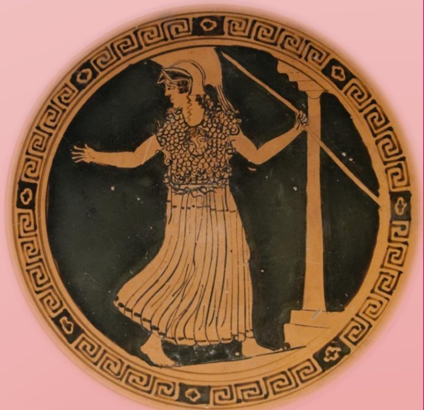
Fig. 4: Atenea en cerámica griega de ca. 500- 490 a.C.

Hasta el momento se ha realizado un proceso heurístico, es decir, de selección y de búsqueda exhaustiva de bibliografía de referencia, general y específica, como también de fuentes históricas y literarias. Por otro lado se ha completado una fase de lectura, clasificación de documentos y de interpretación de bibliografía y de fuentes.