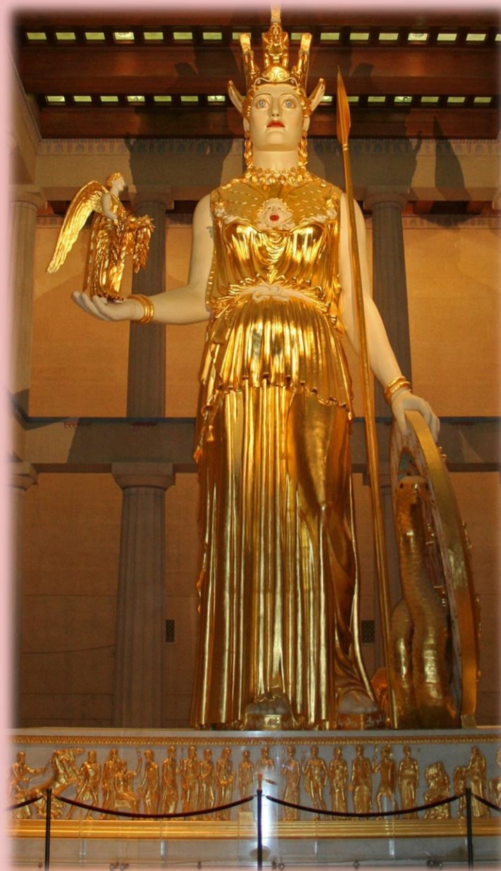
Fig. 1: Escultura de Παρθένος Ἀθηνᾶ en Nashville, EE.UU. Réplica de la original de Fidias, del s. V a. C.