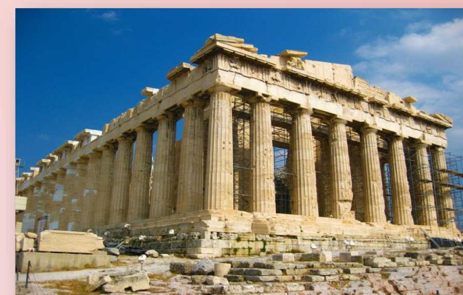
Fig. 3: Partenón, Atenas, Grecia.

Las fuentes históricas (Heródoto, Tucídides, Jenofonte, entre otros) a interpretarse en este trabajo podrían considerarse materiales, pero desde un enfoque cualitativo. Las mismas se analizarán por medio de una metodología combinada