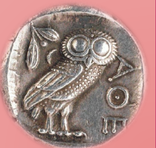
Fig. 6: Tetradracma con lechuza de Atenea

Si bien se ha comenzado la parte expositiva del trabajo, todavía falta profundizar esta etapa de escritura. Es por eso que se habla de resultados parciales, puesto que en este último momento de la investigación se advierte una notable discusión y confrontación entre lo que se ha escrito previamente y lo que se pretende aportar al estudio de la Historia, concretamente en el contexto de la Antigüedad Clásica.