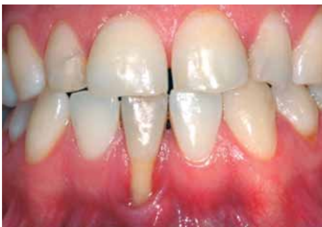
Figura 1: Caso Clínico

Planteamos dos alternativas de tratamiento: realizar un Injerto gingival libre o la Técnica quirúrgica de bolsillo con injerto conectivo subepitelial + L-PRF (3). Tomamos la decisión de realizar la técnica