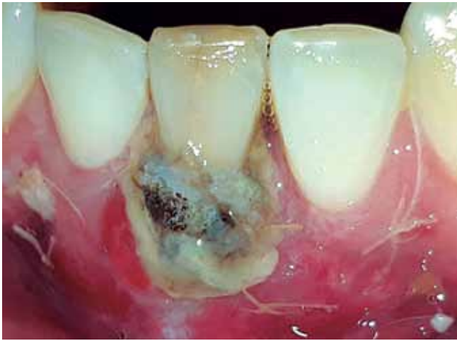
Figura 5a: Control 7 días.