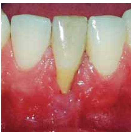
Figura 7a: Control 30 días.