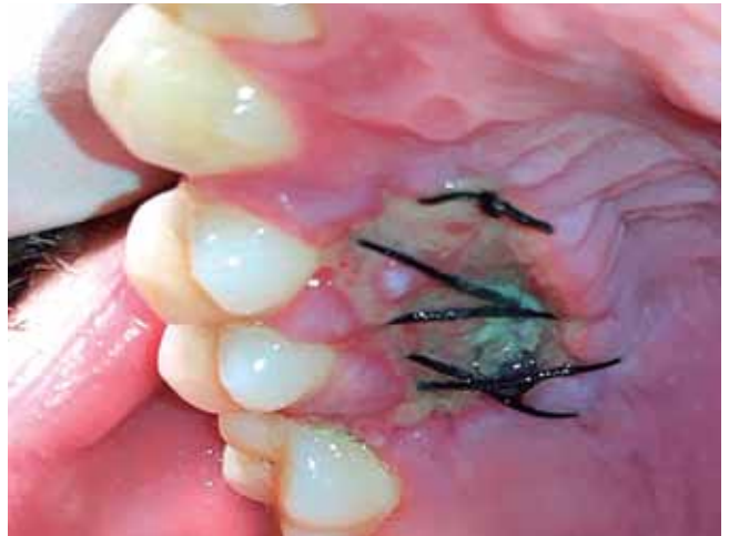
Figura 5b: Control 7 días.