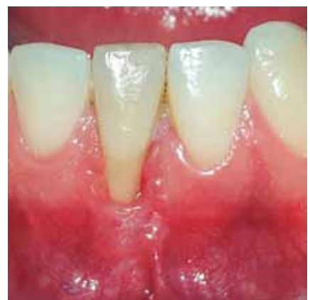
Figura 8a: Control 55 días.