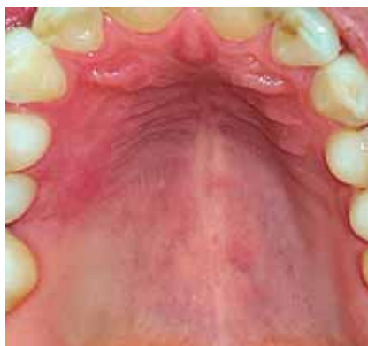
Figura 8b: Control 55 días.

Antes de realizar cualquier procedimiento