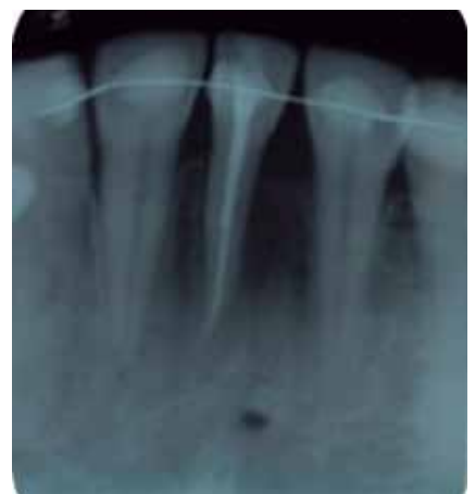
Figura 2: Imagen radiográfica