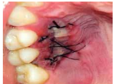
Figura 4b: Control 48hs.