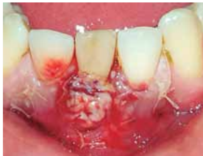
Figura 4a: Control 48hs.