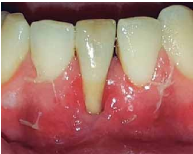
Figura 6a: Control 15 días.