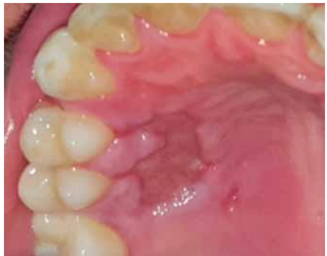
Figura 6b: Control 15 días.