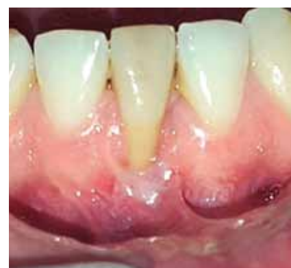
Figura 9: Foto posoperatoria.

de tipo quirúrgico, es de suma importancia que el paciente controle su higiene oral y haya cambiado por completo sus hábitos. Es fundamental la realización de los controles postoperatorios y el cuidado por parte del paciente.