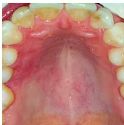
Figura 7b: Control 30 días.