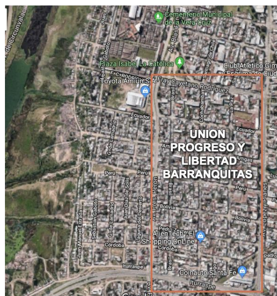
Mapa 2. Ubicación geográfica del barrio Unión, Progreso y Libertad Barranquitas. El límite al oeste está marcado por la Avenida Presidente Perón y separa al barrio de sectores empobrecidos ubicados en el cordón oeste de la ciudad.

La avenida Presidente Perón funciona como límite entre clases sociales, que desata un proceso de otrificación entre un “nosotros-vecinos/otros-sospechosos” (Young, 2007). En definitiva, esta otrificación fuertemente anclada en la inseguridad, produce un distanciamiento social simbólico que encuentra un correlato concreto en la trama urbana que establece sus barreras territoriales e interclase (Camardón, 2011) (mapa 2).