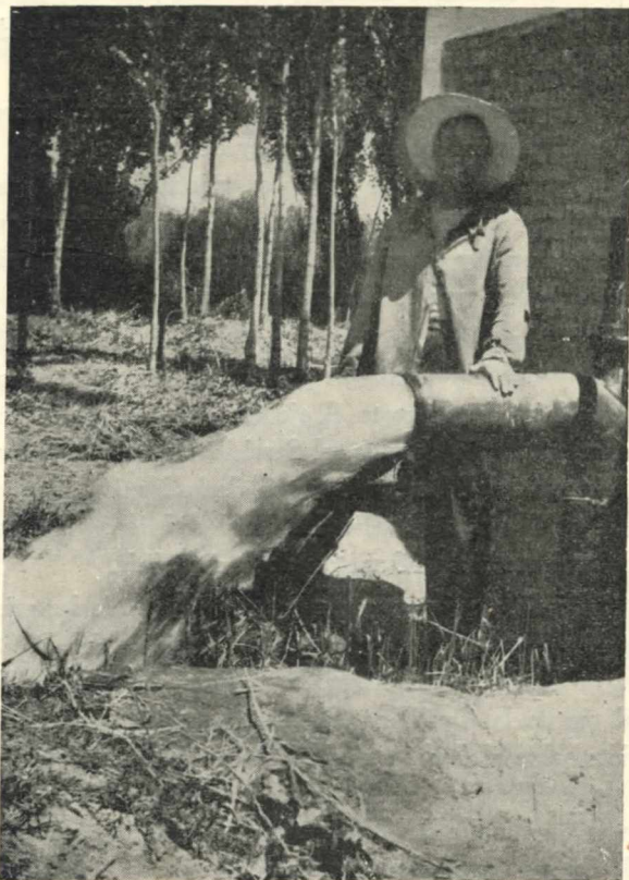
1. - Departamento de Lavalle: Pozo artesiano provisto de un potente compresor que proporciona más de 200.000 litros por hora y contribuye al riego de 63 hectáreas.

data, como así también, mediante numerosas perforaciones realizadas por organismos oficiales y empresas particulares. Esta riqueza hídrica subterránea existe en muchas regiones de Mendoza, en cantidades por cierto nada despreciables y, en una vasta zona de la Provincia, dichos caudales están sometidos a una explotación regularmente intensa.