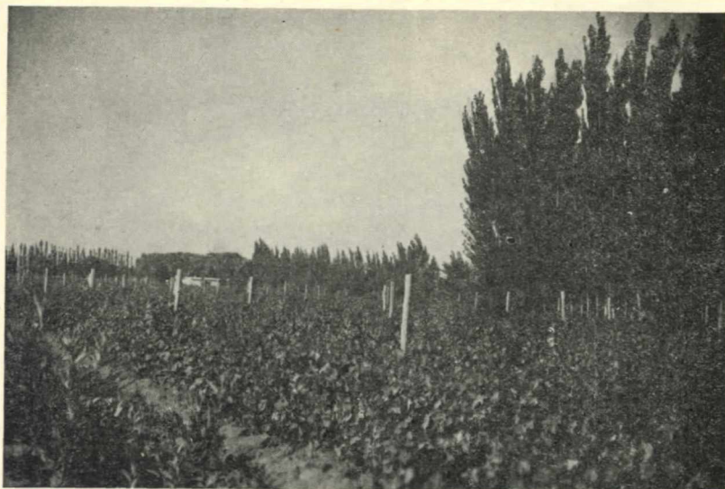
6. - Los caudales del surgente han permitido transformar las tierras áridas y secas, en prósperos viñedos, montes frutales y forestales.

Esta repartición cuenta con personal especializado y, ha cumplido, en el corto espacio de dos años, la tarea previa de realizar el censo de todos los pozos de la Provincia, habiendo confeccionado un minucioso fichero donde consta la ubicación de los pozos, profundidades, caudales, niveles, etc. Este cúmulo de informaciones, se ha consignado cuidadosamente sobre las cartas de los departamentos.