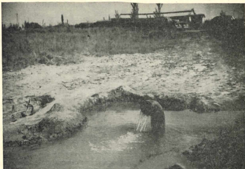
7. - Departamento de Maipú. Surgente en las proximidades de la Estación Barcala del F. C. N. General San Martín, situado en las tierras aún incultas, que se venden "con agua propia" .

Crea la zona de protección para los pozos y establece las medidas que deben regir para determinar el perímetro, dentro del cual será prohibido perforar la tierra para extraer agua (Art. 3º, apartado a) y b)) (34).