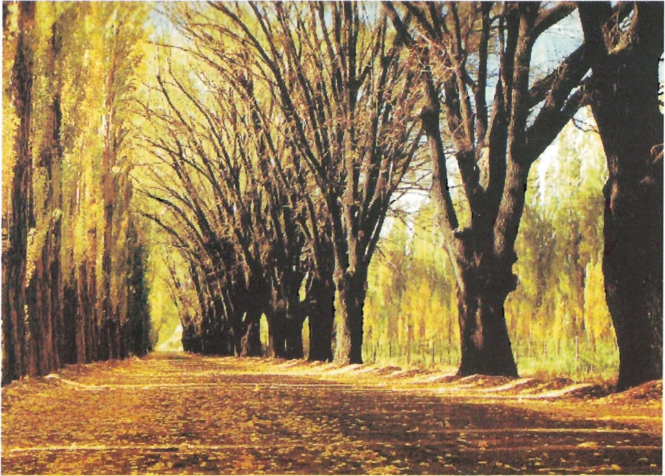
Mendoza en otoño